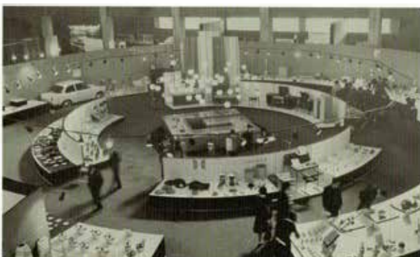
ニッポン・グッド・デザイン・ショー