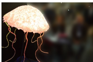
若松さんの光るクラゲ