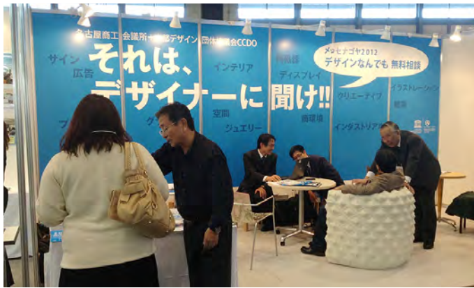
他のデザイン団体などに協力したりと、若手の育成や、デザイン啓蒙活動にも力を入れています。