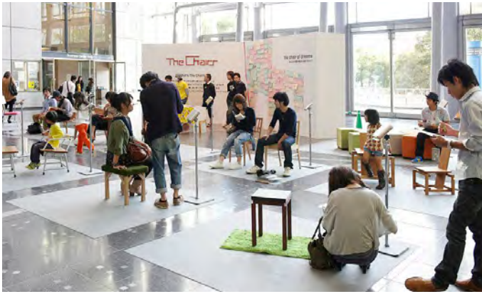
★第6回CCDOデザイン・アワード2011 入賞【2012.03】 ★The Chairs ver.11 in NGOYA DESIGN WEEK 2010: ナディアパーク2Fアトリウム【2010.10.09～11】 テーマ:STORY ワークショップイベント:あなたの夢の椅子創ります