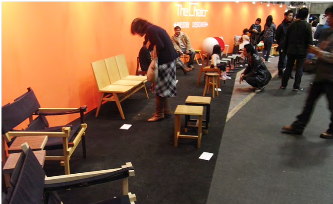
★The Chairs in クリエーターズマーケット:ポートメッセナゴヤ【2008.12.06～07】