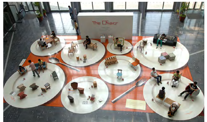
★日本ディスプレイ大賞(DDA) The Chairs展 ver.07 皿の展示ディスプレイ 入選【2005.12】