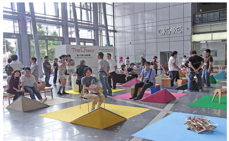
★The Chairs ver.12:ナディアパーク2F アトリウム【2012.09.14～16】 テーマ:制作者の見えないホンネお伝えしちゃいます。 学生Chairs:学生の作品枠 平成24年度愛知県文化活動事業費補助金 企画提案事業(国内実施)