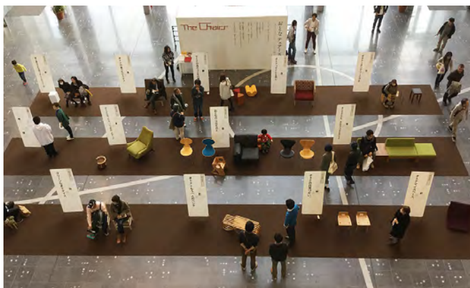
★TheChairsver.13:ナディアパーク2F アトリウム 【2014.11.21～23】テーマ:おとなチェアーズ 学生Chairs Part2:学生の作品枠 平成26年度愛知県文化活動事業費補助金 文化芸術すそ野づくり事業