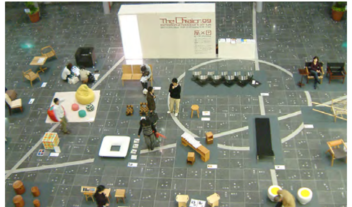
★The Chairs ver.09:ナディアパーク2Fアトリウム 【2007.10.26～28】 テーマ:座×?